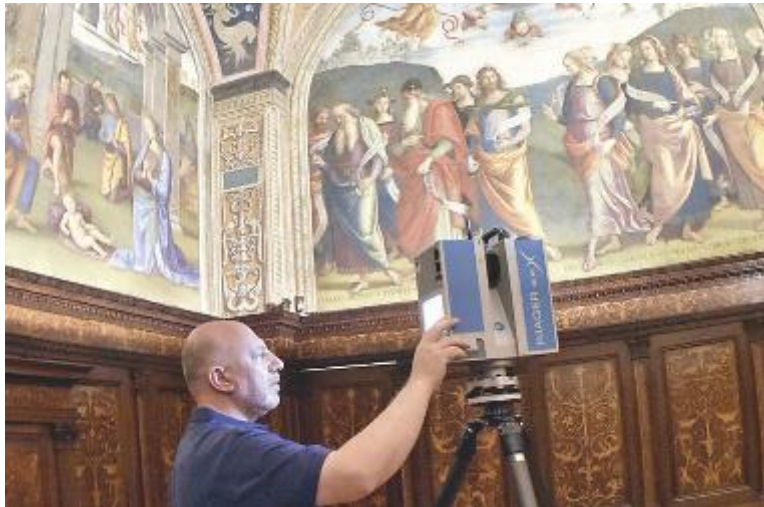
Le fasi di rilievo laser nel cantiere di lavoro al Collegio del Cambio