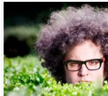
Simone Cristicchi: un percorso teatro-cantabile "Paradiso"