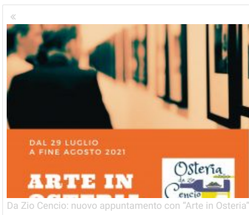
Da Zio Cencio: nuovo appuntamento con "Arte in Osteria"

Appuntamenti, Arte, Musica città della pieve